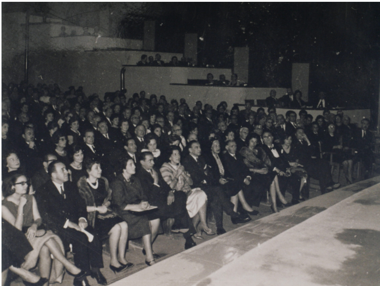
Το κατάμεστο Βασιλικό κατά την περίοδο των αρχών της δεκαετίας του '60

Το νεοσύστατο Κρατικό Θέατρο Βορείου Ελλάδος στεγάζεται το 1961 στην Εταιρία Μακεδονικών σπουδών.