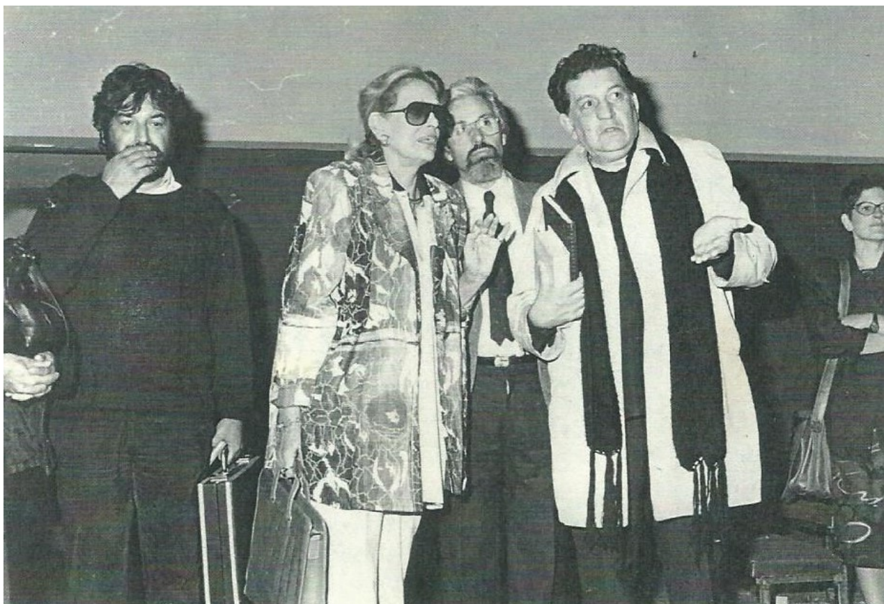
Η Μελίνα Μερκούρη με τους Μίνωα Βολανάκη και Δημήτρη Σαλπιστή

Η Μελίνα Μερκούρη ως Υπουργός Πολιτισμού έβαλε και πάλι το Βασιλικό Θέατρο στον «χάρτη» της Θεσσαλονίκης. Η παράσταση που έπαιξε ως Μήδεια το 1976 στον ιστορικό χώρο, με τον Μίνωα Βολανάκη ως τότε Καλλιτεχνικό Διευθυντή του ΚΘΒΕ να συνεπικουρεί στην προσπάθεια αξιοποίησης του χώρου, είναι πιθανό να διαδραμάτισε το ρόλο της. Τα χρόνια που ακολούθησαν η Μερκούρη επέμεινε στη συγκρότηση επιτροπής για ανακατασκευή και αξιοποίησης και εύρεσης κονδυλίων και ασχολήθηκε σημαντικά με το θέμα.