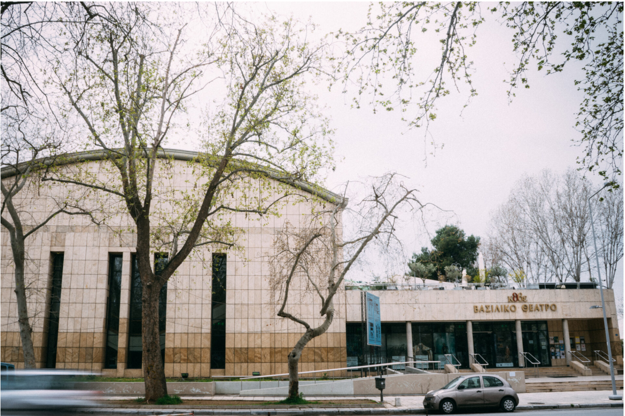
Η εξωτερική όψη του Βασιλικού Θεάτρου, σε εικόνα της δεκαετίας του '90

εργάστηκαν χιλιάδες άνθρωποι του θέατρου και των τεχνών. Και η απόφαση η ονομασία του να παραμείνει «Βασιλικό», όπως το έμαθαν γενεές Θεσσαλονικέων, επί δεκαετίες, το μετατρέπει πια στις συνειδήσεις όλων μας, σε τοπόσημο της πόλης.