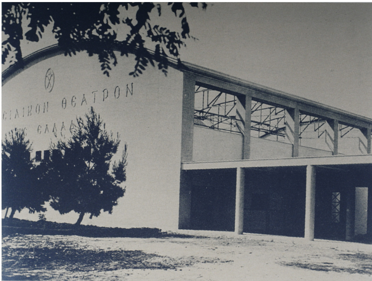
Το Θερινό Βασιλικό το 1940

Ο νεαρός πολεοδόμος, τότε, Κωσταντίνος Δοξιάδης , σε συνεργασία με τον Αρθούρο Σκέπερς, «υπέγραψαν» τα σχέδια και την κατασκευή του το 1940, λίγο πριν από την κήρυξη του πολέμου.